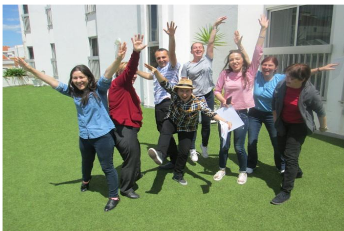
Festivitatea de absolvire