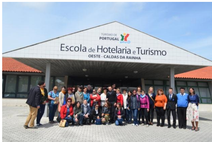
Vizitarea unor școli din Caldas da Rainha